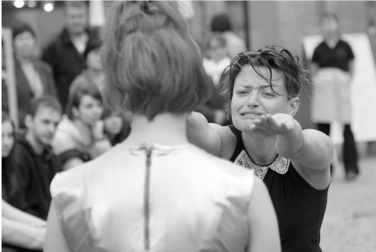
Sestřičky brněnského Divadla Krajiny na Pivovarském náměstí

LS: Ano, to už bylo po prázdninách, po létě, takže se to muselo smrsknout do menšího prostoru. Dálky se zúžily, jinak v principu je to stejné. Tento festivalový