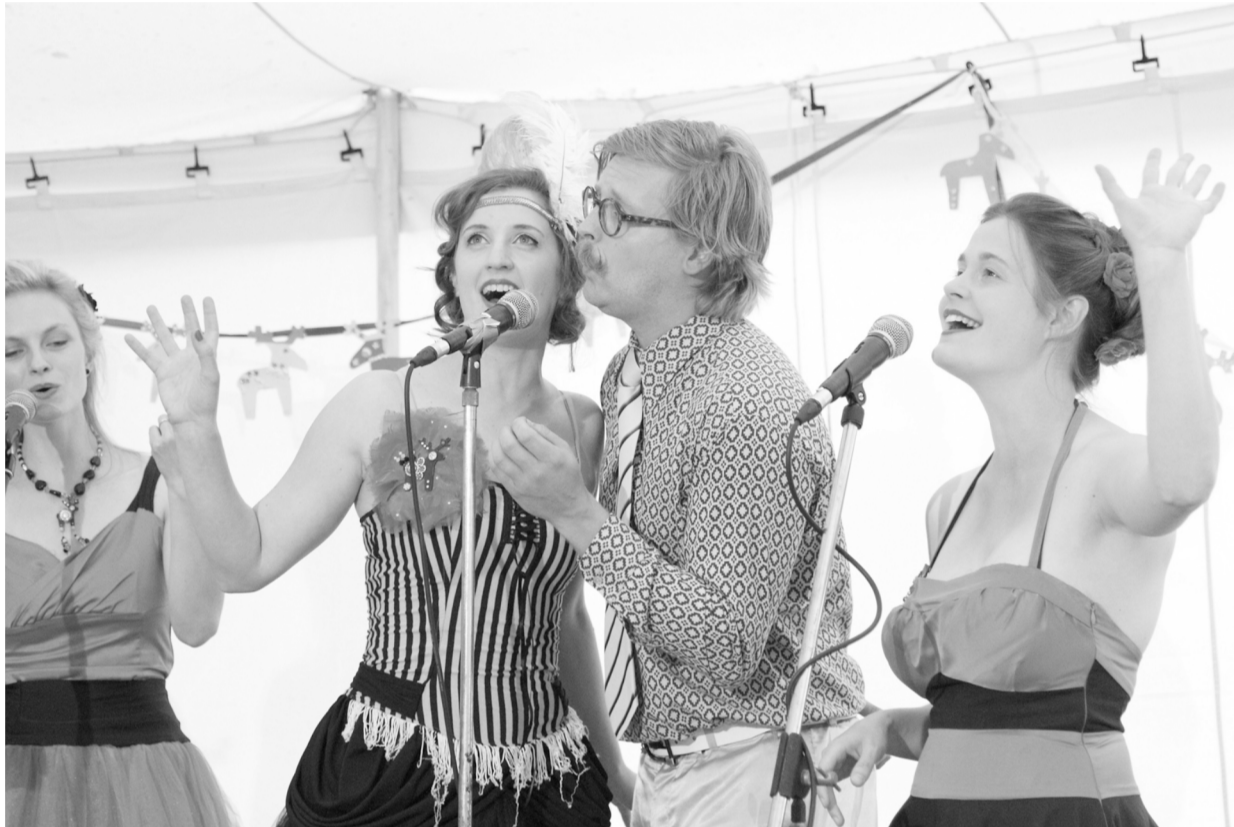
Jelení loje, okouzující

Přesně tak. Vybíral jsem tak, aby bylo skutečně jasné, že muzika je různorodá a proměňuje se. Nebo jak bych to úplně shrnul – to, co člověk může vidět, jsou právě proměny muziky. Djsety v Open