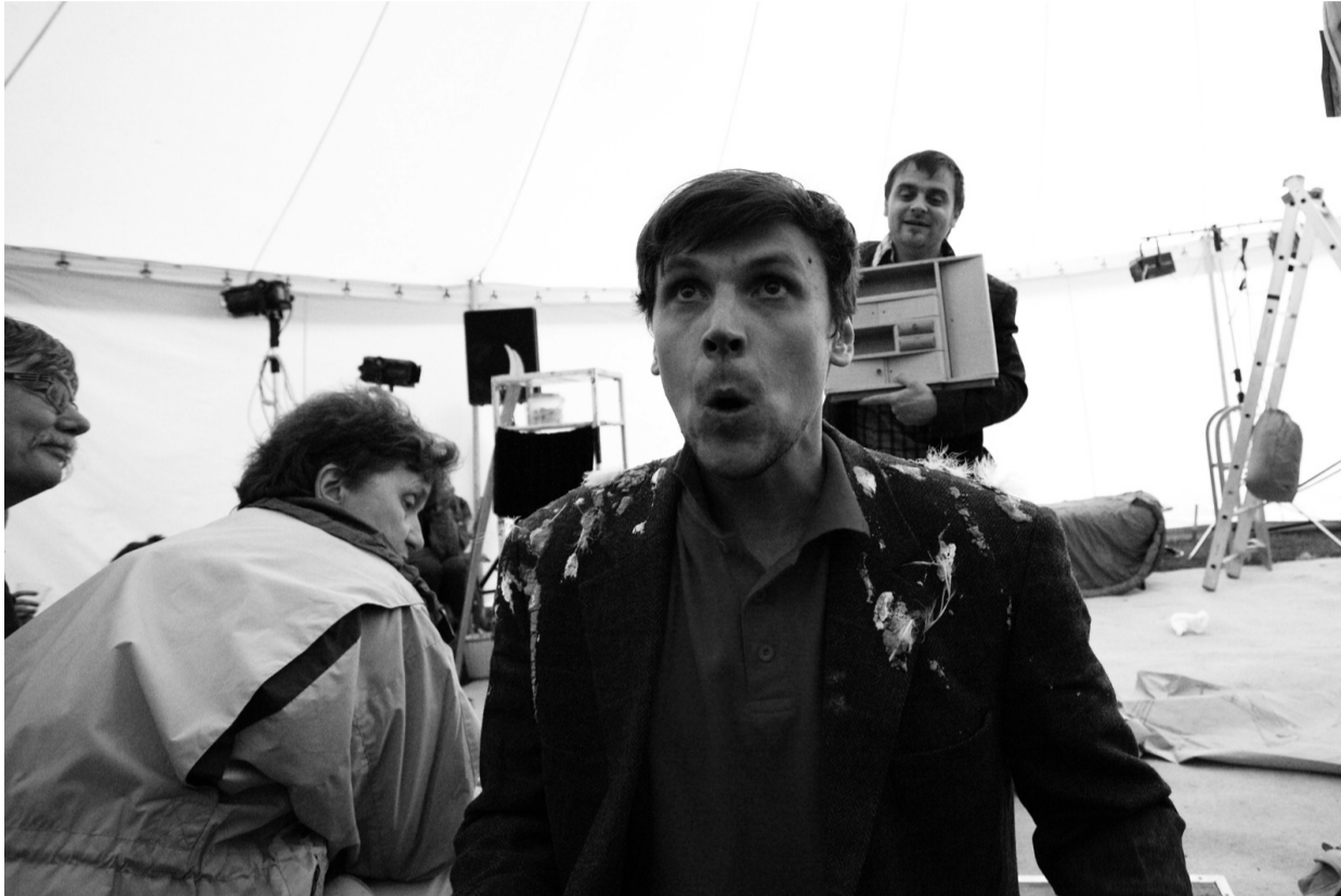
Včerejší představení Hú is Húv uskupení Kvartel

v jednom prostoru a je to více méně taková improvizace. Stojí to na hercích. Vycházeli jsme z textu Pan sova od Arnolda Lobela a to je všechno. My fungujeme hodně bez dramaturga. Já text napíšu, a pak vzniká vizuál vzájemnou komunikací s ostatními. To, že nemáš na scénografii prachy, tě taky hodně osvobodí. Najdeš klacek a můžeš s ním udělat velkou srandu.