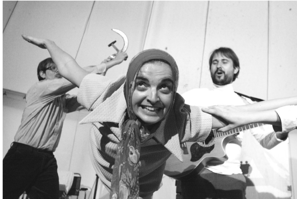
Divadlo Športniky se svou inscenací Gagarin na loňském ročníku Open Air Programu

soustředěná kolem mima a performeru Daniela Hernandeze . Ze zahraničních souborů dále uvádíme např. slovenské Celkom malé divadlo a slovinšský soubor Moment z Mariboru . Letošní dramaturgie obsahuje také řadu improvizčních představení a stand-up comedies, jejichž vyvrcholením bude v pátek 27. 6. exhibice ve Slam poetry .